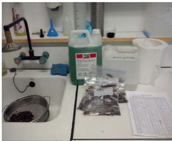
Figure 3 : Lavage au Teepol® des abeilles

2h pour 60 échantillons à laver à 2 personnes