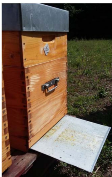
Figure 1 : Le linge se place sous la ruche et doit pouvoir être facilement enlevé et remis.

3h pour 120 ruches peu infestées à 2 personnes